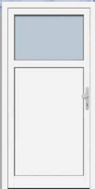
Modell KB NTA 65-20