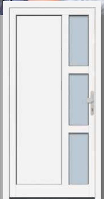
Modell KB NTA 65-80

Technische Änderungen, Satz- und Druckfehler vorbehalten.