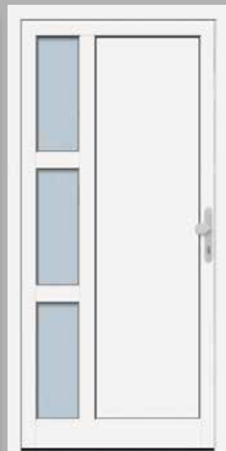
Modell KB NTA 65-70