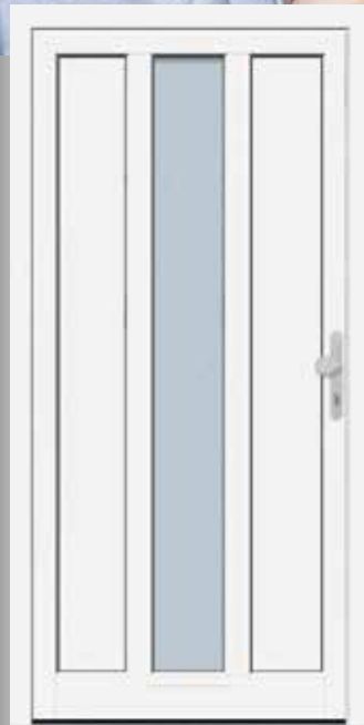
Modell KB NTA 65-60