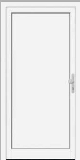
Modell KB NTA 65-10