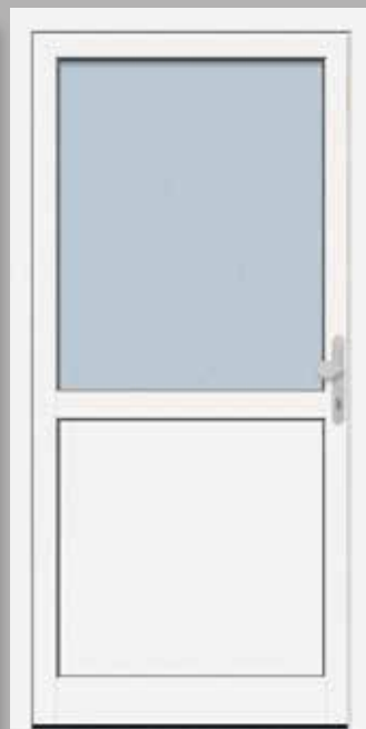
Modell KB NTA 65-30