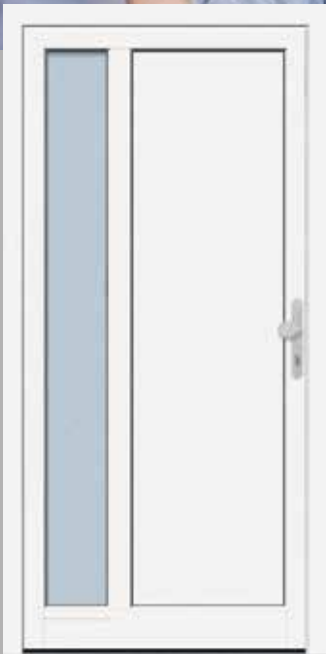
Modell KB NTA 65-40