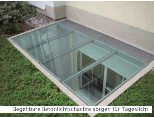
Begehbare Betonlichtschächte sorgen für Tageslicht