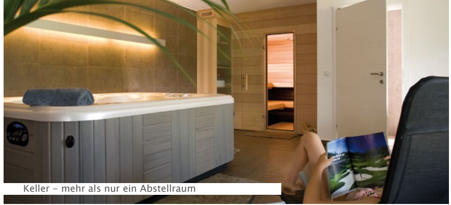
Keller – mehr als nur ein Abstellraum