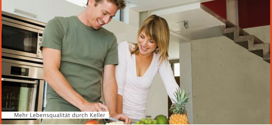
Mehr Lebensqualität durch Keller

Weitere Informationen erhalten Sie unter www.prokeller.de