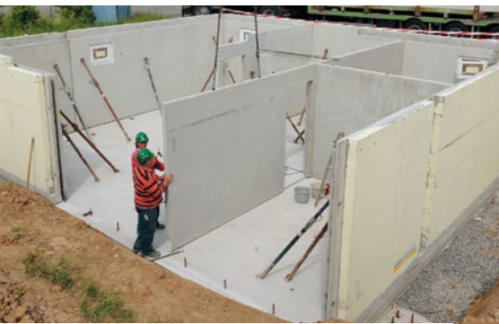
Fertigkeller verkürzen die Bauzeit und sparen Geld