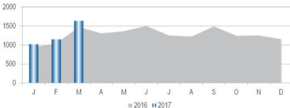
Veränderung zum jeweiligen Vorjahresmonat in %